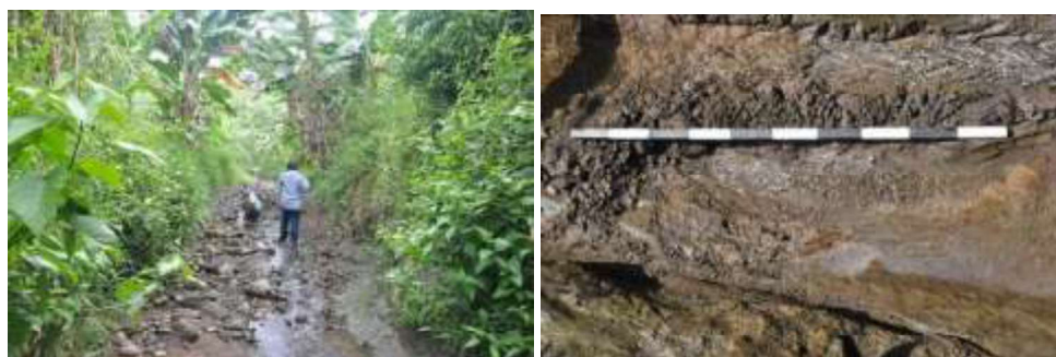
Gambar 4. Kegiatan survei di sepanjang aliran Kali Lemah Putih (Kiri) dan temuan tulang panjang Probocidae di dasar Kali Lemah Putih (Kanan) (Dok. Penulis)

Di dasar Kali Kedung Cina ditemukan batuan breksi piroklastika dengan struktur kerak roti anggota Formasi Kancilan dari Plestosen Awal sekitar 1.8 juta tahun yang lalu. Batuan ini terbentuk pada awal pembentukan daratan di kawasan Patiayam. Di atas batuan tersebut, ditemukan fosil post-cranial dari satu individu jenis Bovidae . Temuan ini