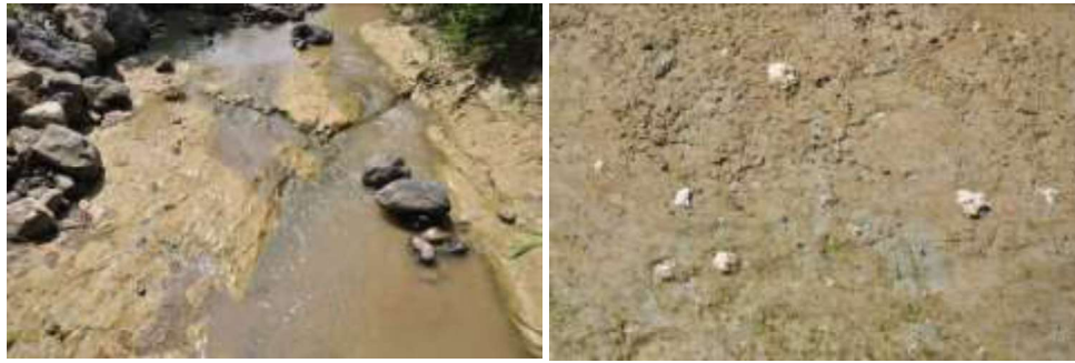
Gambar 6. Singkapan endapan lempung biru anggota Formasi Jambe di Kali Kedung Rumpon (Kiri) dan fragmen fasies marin pada endapan lempung biru (Kanan)

dan E 110° 56' 54.8", dan ketinggian 84 m dpl. Di lokasi ini terdapat singkapan batulempung biru dengan fasies marin yang berasal dari endapan laut dangkal. Batuan ini merupakan anggota Formasi Jambe yang berumur Akhir Pliosen, dari sekitar 2 juta tahun yang lalu. Pada endapan batulempung ini dijumpai fosil gigi ikan hiu dan kerang laut. Endapan tersebut terbentuk ketika kawasan Patiayam masih berupa laut dangkal, dan belum berevolusi menjadi daratan (Siswanto 2013, 18).