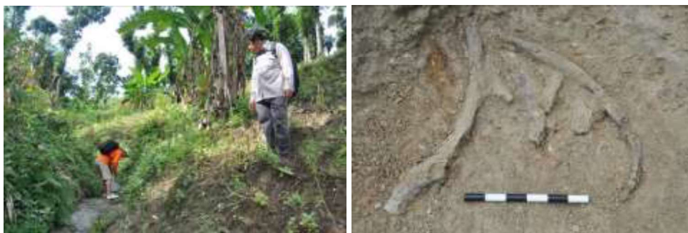
Gambar 5. Pengamatan litologi di Kali Kedung Cina (Kiri) dan temuan konsentrasi tulang Bovidae di tebing Kali Kedung Cina (Kanan)

Plestosen Tengah, sekitar 1 juta tahun yang lalu (Siswanto 2013, 17).