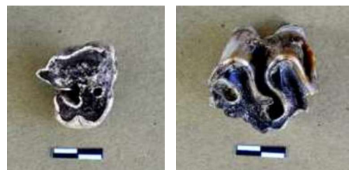
Gambar 8. Foto gigi geraham atas Hexaprotodon simplex (?) dan Hexaprotodon sivalensis

Kelompok fauna vertebrata tertua di Jawa adalah Fauna Satir berumur 1.5 juta tahun yang lalu, yang berasal dari awal pembentukan daratan di Pulau Jawa (Semah 1982, 151 -- 164; Suzuki et al., 1985, 309 -- 331). Karakter fauna dari periode ini didominasi oleh fauna kepulauan, paket Sinomastodon dan Geocelone (de Vos et al., 1994, 130). Anggota fauna Patiayam dari periode ini adalah Hexaprotodon simplex (?), berupa gigi molar atas dewasa yang berukuran sangat kecil. Lebih kecil dari pada ukuran molar atas dewasa Hexaprotodon sivalensis yang juga ditemukan di situs ini. Pada masa itu, kemungkinan telah muncul daratan yang dapat dihuni oleh jenis hewan ini di kawasan Patiayam. Namun mengingat