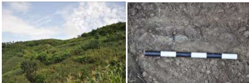
Gambar 7. Kondisi lingkungan Bukit Balung Buto yang banyak ditemukan fosil vertebrata (Kiri) dan fragmen tulang panjang Probocidae di kaki bukit (Kanan) (Dok. Penulis)

Bukit Balung Buta terletak di timur Sukobubuk. Di Puncak Bukit Balung Buta dijumpai singkapan aglomerat lahar Gunung Muria anggota Formasi Sukobubuk, kemudian dibawahnya adalah batulempung Formasi Kedungmojo yang sangat tebal. Di dasar Bukit Balung Buta dijumpai litologi batupasir tufaan Formasi Slumprit yang terkubur ratusan meter di