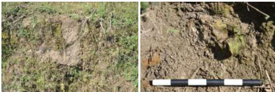
Gambar 3. Singkapan Batupasir Tufaan anggota Formasi Slumprit (Kiri) dan Temuan epiphysis distal Humerus Bovidae di Bukit Slumprit (Kanan).

Bukit Gecil terletak sekitar 1 Km di sebelah barat Bukit Slumprit, ke arah