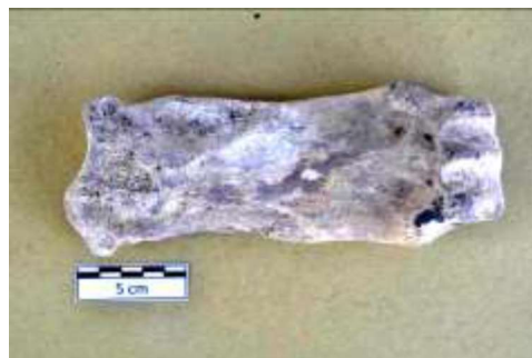
Gambar 9. Foto metacarpal Hexaprotodon sivalensis (Dok. Penulis).

Kelompok fauna selanjutnya adalah Fauna Cisaat yang berumur 1.2 juta tahun yang lalu (Semah, 1984). Karakter fauna dari periode ini adalah fauna darat yang ditandai dengan kemunculan Stegodon trigonocephalus dan Cervidae (von Koenigswald 1935, 188 -- 198). Bersama paket ini adalah Hexaprotodon sivalensis yang fosilnya telah ditemukan di situs Patiayam, berupa tulang metacarpal (kaki depan) dan gigi molar atas. Hexaprotodon sivalensis adalah spesies kuda air yang ditemukan di Asia Daratan. Nama sivalensis mengindikasikan bahwa migrasi fauna ini berasal dari Asia Selatan, atau yang dikenal dengan paket fauna Siva-Malaya. Untuk fauna jenis ini yang hidup di