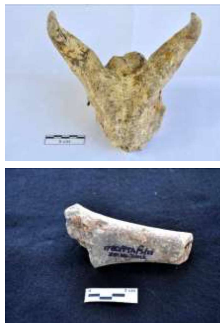
Gambar 10. Foto tengkorak Duboisia santeng dan femur Carnivore kecil.

Jenis Bovidae kecil yaitu Duboisia santeng yang merupakan fauna endemik Jawa juga ditemukan di situs Patiayam ini. Dengan ditemukannya fauna ini pada Formasi Slumprit, maka mengukuhkan usia litologi tersebut sekitar 1 juta tahun yang lalu. Pada masa ini kondisi lingkungan Patiayam didominasi oleh hutan terbuka, sehingga juga merupakan habitat yang baik bagi penyebaran dua kelompok Cervidae besar yaitu Cervus dan Axis ; serta jenis Cervidae kecil yaitu Muntiacus Muntjak . Carnivore besar dari jenis Pantera tigris merupakan rantai paling atas di situs Patiayam ini. Selain itu juga ditemukan jenis carnivore kecil (?), yang belum dapat diketahui jenisnya. Berdasarkan bentuknya yang sangat kecil, mungkin berasal dari kelompok Canidae atau Mustelidae . Periode Trinil Hk menjadi puncak periode penghunian situs Patiayam baik oleh beragam fauna daratan maupun Homo erectus dengan jejak budayanya. Hal ini dibuktikan dari penelitian yang dilakukan oleh Sartono dan Zaim pada tahun 1979 berupa temuan gigi premolar dan kepingan atap tengkorak yang kemungkinan berumur sekitar 0.9 juta tahun yang lalu. Selanjutnya, penelitian Siswanto tahun 2007 hingga 2012 menemukan beberapa alat batu masif serta beberapa alat tulang.