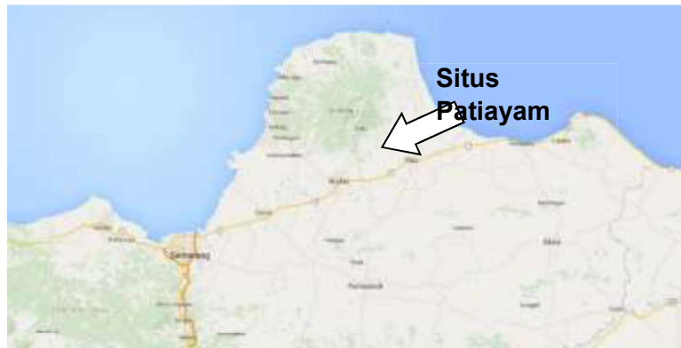
Gambar 1. Lokasi Keletakan Situs Patiayam

350 m dpl. Para peneliti terdahulu, seperti Sartono dkk. (1978, 5) menyebut perbukitan Patiayam sebagai kubah ( dome ) Patiayam. Menurut mereka, kubah tersebut terbentuk selama Kala Plestosen sekitar 0,9 - 0,5 juta tahun lalu.