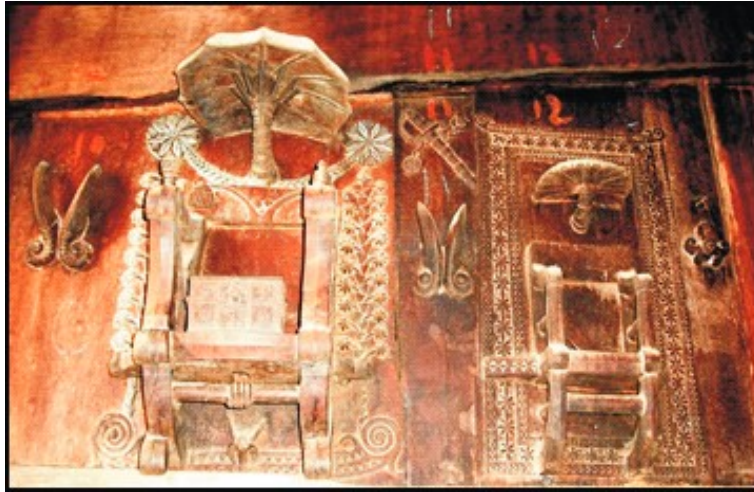
Gambar 5. Pahatan replika sepasang kursi (singgasana) di omo sebua Bawömataluo

pada tahun 1878 (Hämmerle 1990, 153). Simbol kebangsawanan hadir pada pahatan tersebut, antara lain berupa bentuk mahkota dan sebuah peti wadah emas yang digambarkan terletak pada dudukan kursi yang berukuran lebih besar. Pahatan sebuah tangan sebatas pergelangan tampak menggenggam penyangga kaki kursi yang berukuran lebih besar.